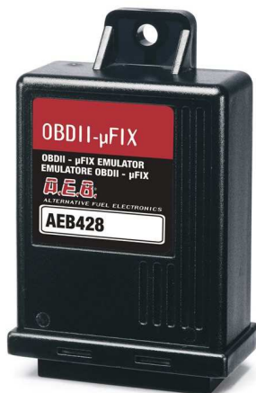
Ilustrační ukázka resetovacího zařízení

Zvláštním případem jsou jednotky, které provádějí reset paměti závad řídicí jednotky motoru, např. AEB \mu -fix. Obvykle se připojují ze zadní strany diagnostického konektoru. Jejich použití je akceptovatelné pouze u vozidel poháněných LPG/CNG a to pouze do termínů, uvedených v tabulce v Příloze 3. Ve všech ostatních případech vyhodnotíme jejich přítomnost jako závadu.