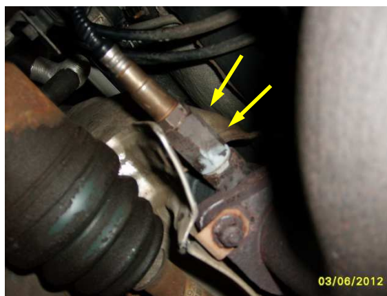
...a jeho montáž na vozidle