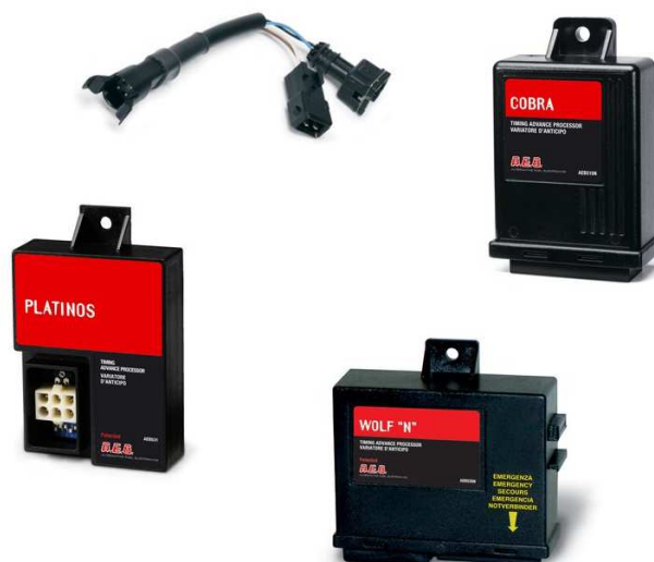
Ilustrační ukázka variátorů předstihu zážehu s přípojemným kabelem

U vozidel poháněných LPG/CNG se používají tzv. variátory předstihu zážehu. Jejich přítomnost jako závadu vyhodnocovat nebudeme. Tyto variátory jsou vždy homologované z hlediska EMC.