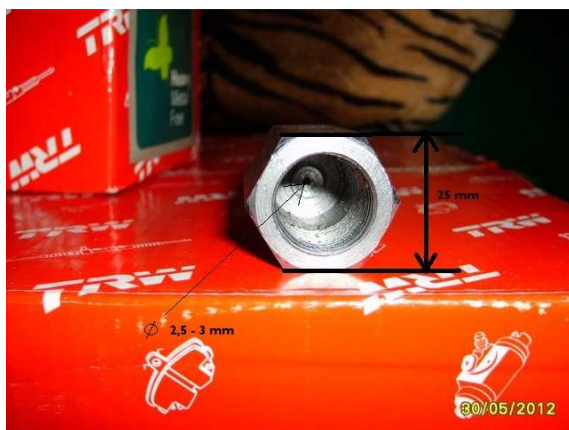
Mezikus upevnění kontrolní lambda sondy za katalyzátorem, otupující její reakci...

apod.), těsnění přírub a spojů, upevnění tepelných štítů a zjevné nepřípustné modifikace (např. montáž sportovních tlumičů výfuku).